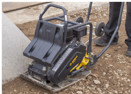
Robuste et fiable Courroies trapézoïdales complètement protégées contre les dommages