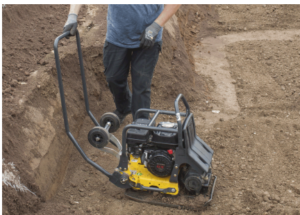
Léger et maniable Compact et à suspension