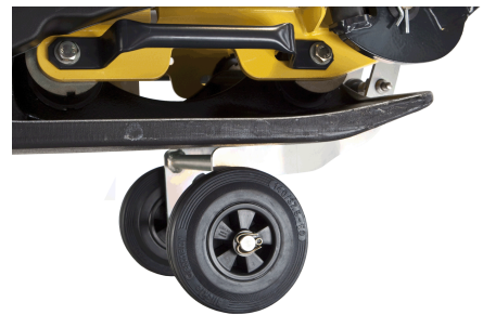
Transport sécurisé Poignées de transport (en série) et roues de transport (en option)